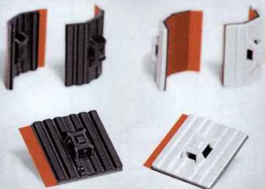
Les embases adhésives flexibles FlexTack, disponibles en noir et blanc