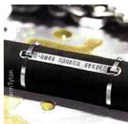
Exemple de repère Inox.