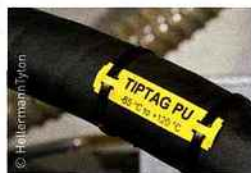
Exemple de repère Tiptag.