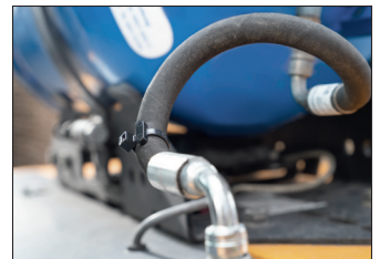
HTrack web, une solution de choix pour vos opérations de maintenance.