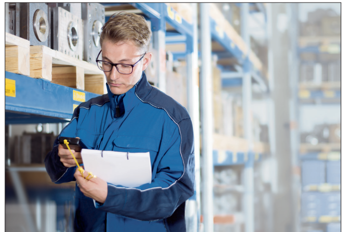
HTrack mobile la solution idéale pour vos opérations d'inventaire.

Cependant, si vous avez besoin d'optimiser et de personnaliser HTrack mobile pour répondre au mieux à vos besoins, nous vous proposons notre service de développement de logiciels et d'applications mobiles HTrack plus . Nous serons heureux de vous accompagner dans votre projet.