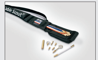
Tire-fils Cable Scout + Luxe - 897-90001.

Peut être utilisé en combinaison avec nos tire-fils Cable Scout + .