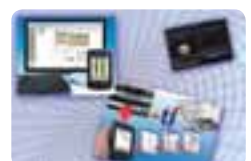
Logiciels de gestion.