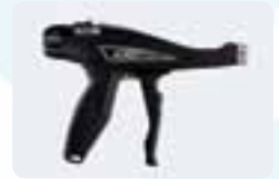
Outils de pose.