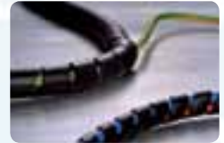
Protection des câbles.