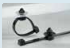
Systèmes de fixation.