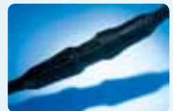
Protection des câbles.