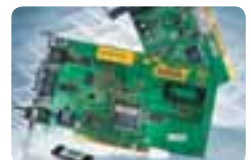
Impression transfert thermique.