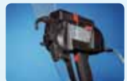
Outils de pose.