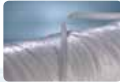
Ficelles de frettage.