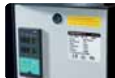
Étiquettes de protection.