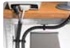
Systèmes de protection.