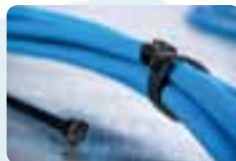
Colliers de serrage.