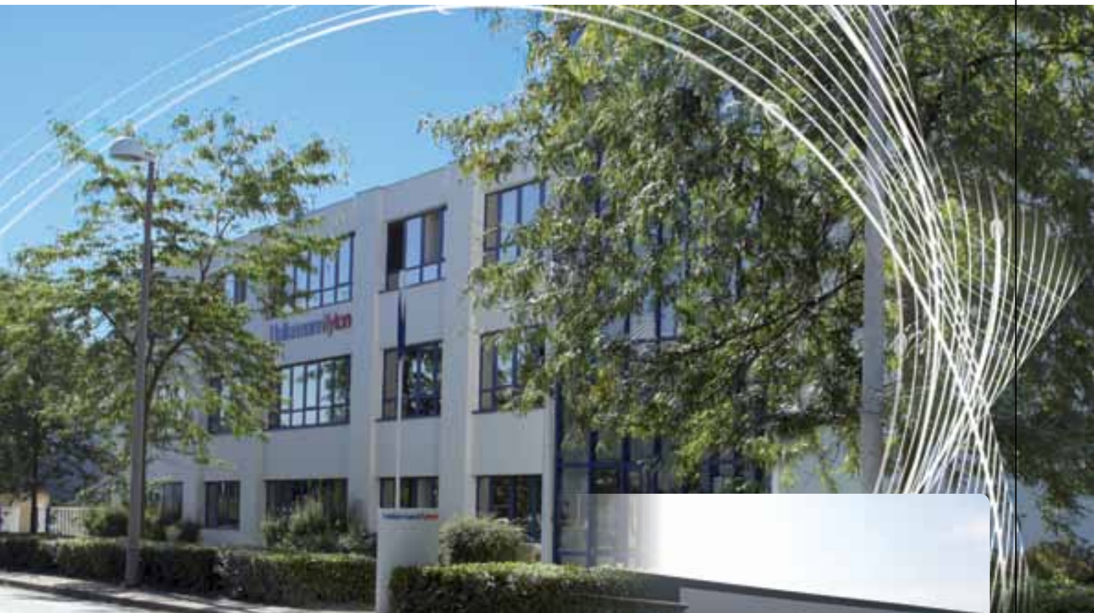
Site de Trappes : Siège social et centre de production.

Le siège social HellermannTyton est implanté en France depuis 1962. Basé à Saint-Quentin-en-Yvelines dans le 78, HellermannTyton S.A.S. emploie plus d'une centaine de personnes et dispose de son propre site de production, centre d'excellence en matière de développement et de production de «fixations et solutions élaborées».