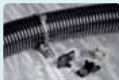
Lanières de fixation.