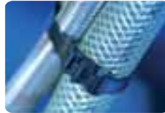
Colliers de serrage.