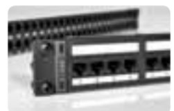
Panneaux de brassage.