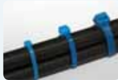
Colliers de serrage.