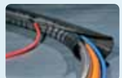
Protection des câbles.