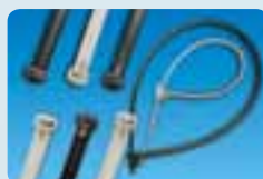
Colliers de serrage.