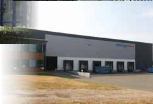
Site de Coignières : Centre logistique et stock central Européen.