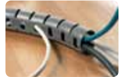
Protection des câbles.