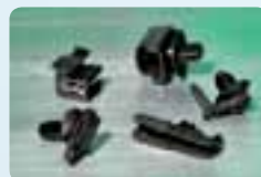
Clips pour connecteurs.