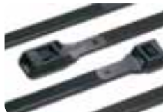
Colliers de serrage.