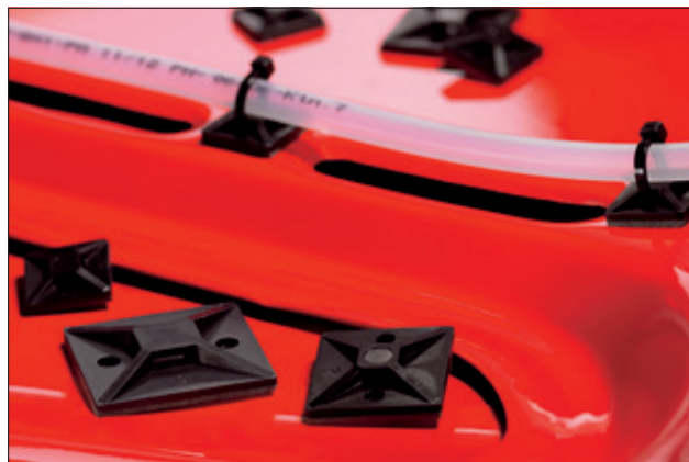
Grâce aux embases de la série SolidTack, la fixation devient possible même sur des surfaces peintes ou vernies.